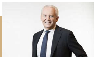
Schirmherr Dr. Rüdiger Grube

für einen Monat gesunde und ausgewogene Ernährung